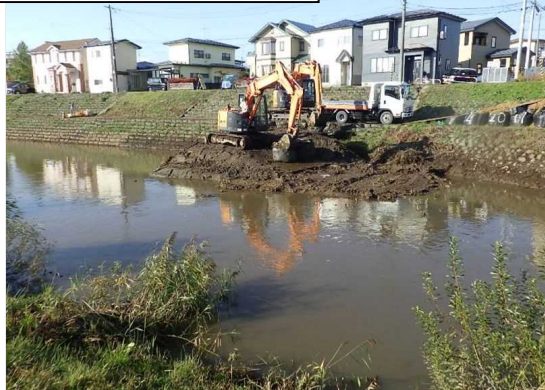
家屋連担地での掘削作業