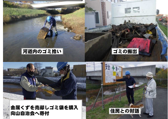
河道内のゴミ拾い